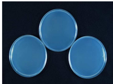
24時間後の菌の繁殖状態